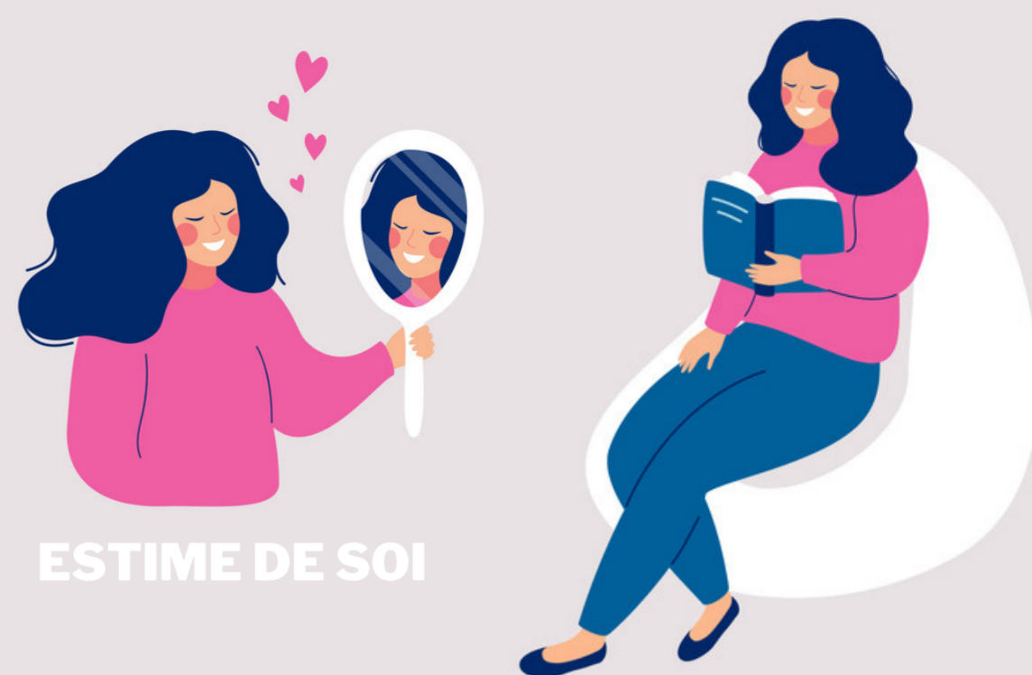
ESTIME DE SOI